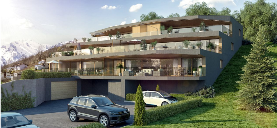
vue sur la façade Sud

CH-1965 Drône (Savièse), route de Monteiller