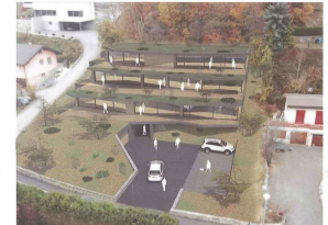
orientation Sud Est orientation Sud Ouest